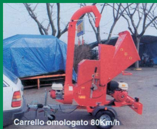
Carrello omologato 80Km/h