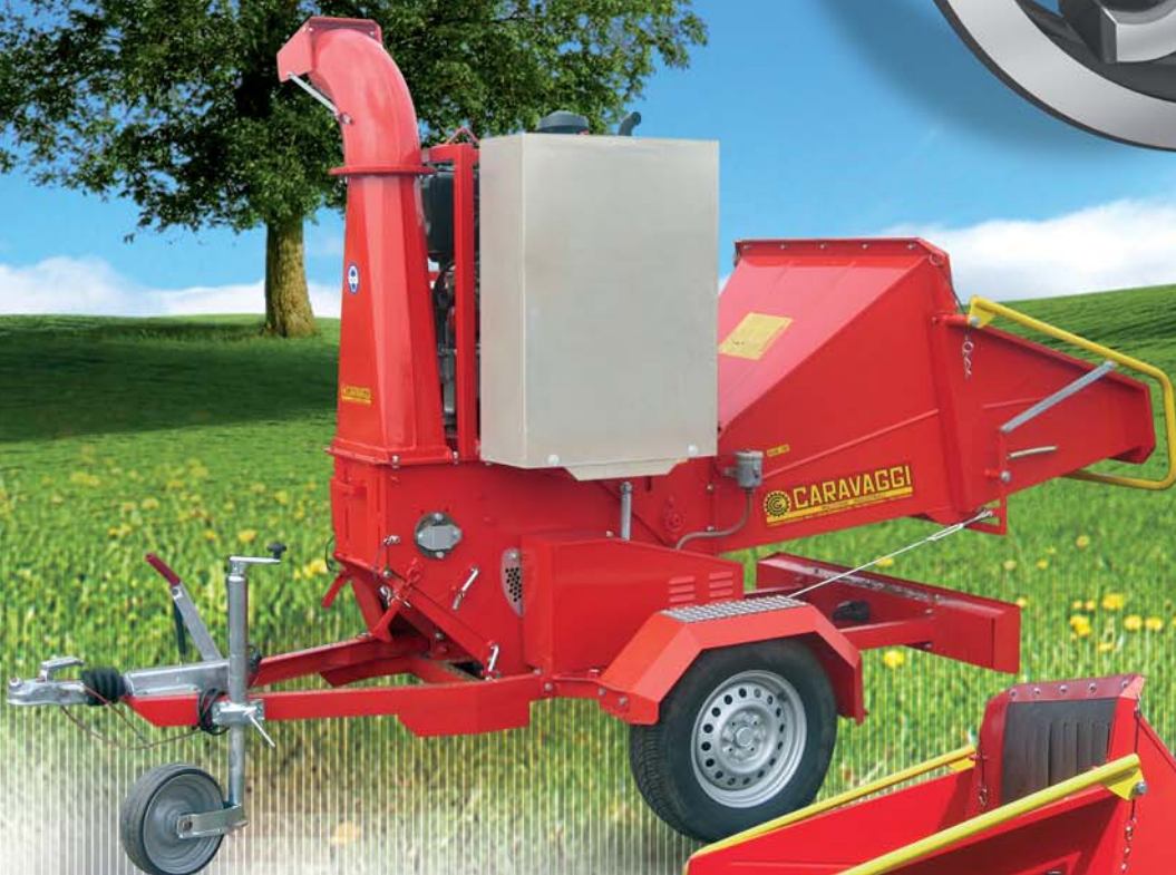
DIESEL 27 CV Carrello stradale 80 Km/h