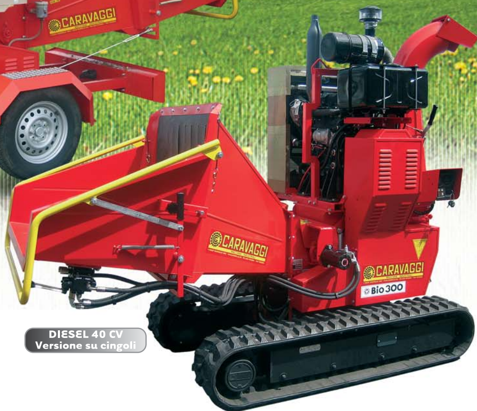
DIESEL 40 CV Versione su cingoli