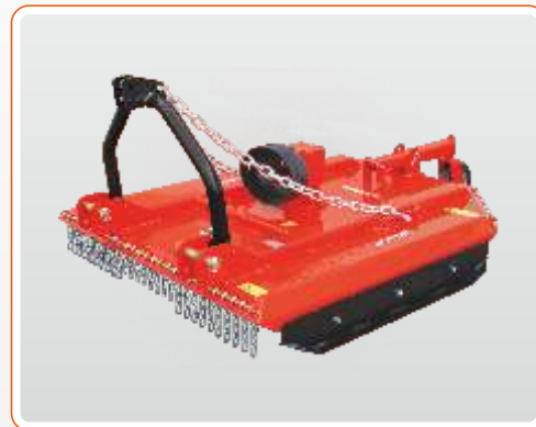
CMJ - 150