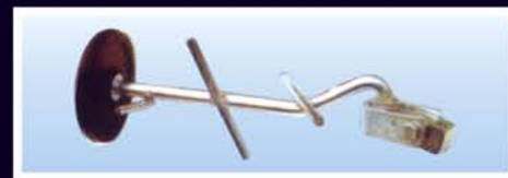
Agitador com disco em borracha antiácido Agitador con disco en goma antiácido Agitateur avec disque en gomme anti-ácide