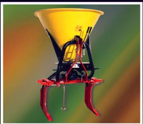
Distribuidor com subsolador de 2 linhas Abonadora com subsolador de 2 líneas Distributeur avec sous-soleur 2 lignes