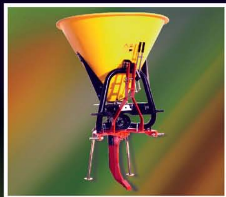
Distribuidor com subsolador de 1 linha Abonadora com subsolador de 1 línea Distributeur avec sous-soleur 1 ligne